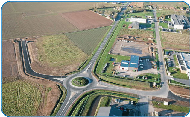
Vue aérienne du Parc d'activités Gros Jacques