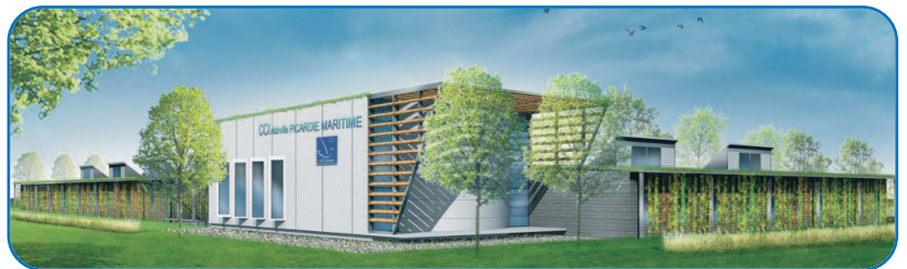
Pépinière d'entreprises énergies renouvelables - Perspective depuis la RD925